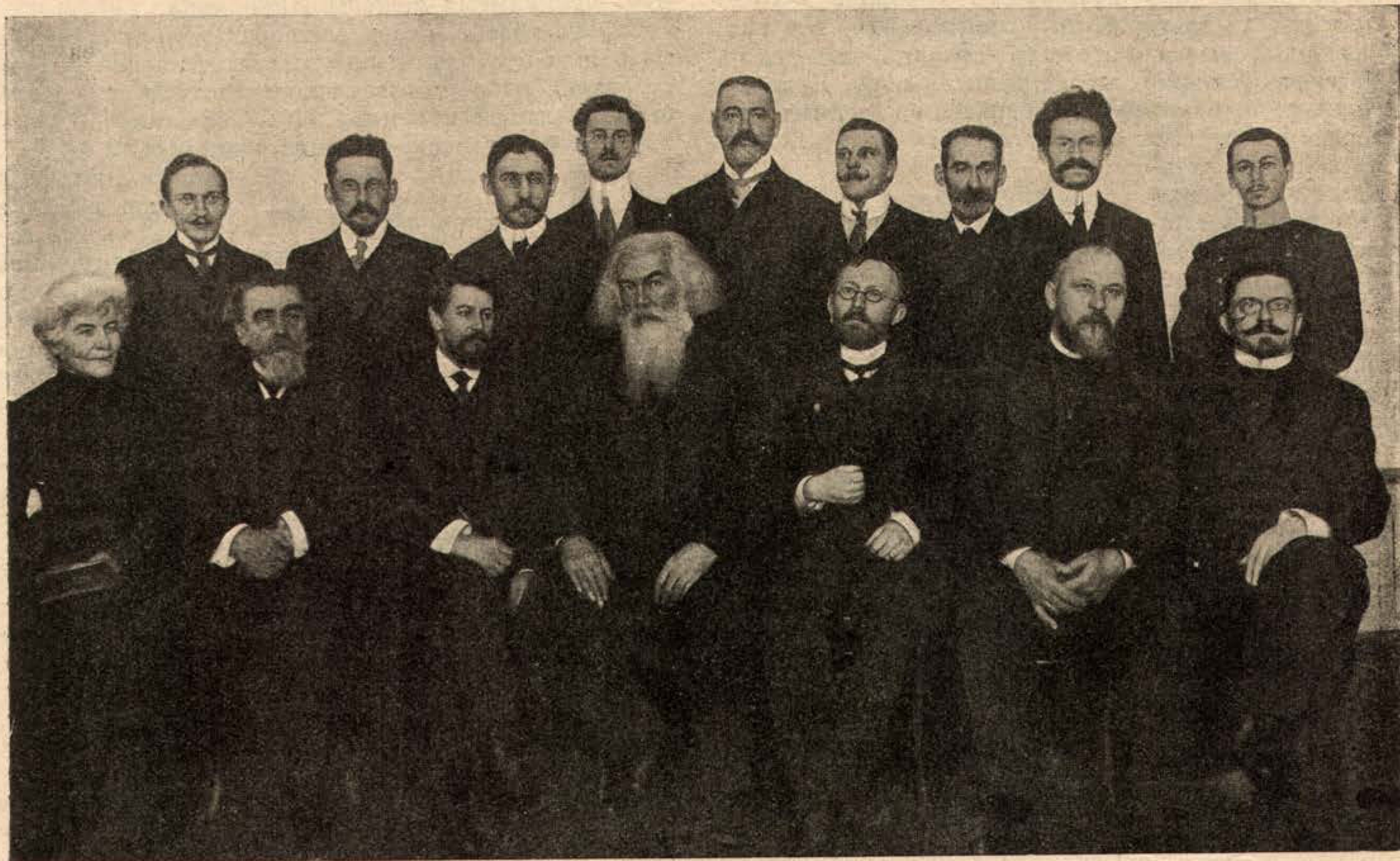
Редакція и группа петербургскихъ сотрудниковъ журнала „Природа и Люди“.

Самаго процесса печатанія на типографскомъ станкѣ мы описывать не станемъ—онъ извѣстенъ всякому. Замѣтимъ лишь, что изъ подъ машины номеръ выходитъ въ видѣ огромнаго, несложнаго листа бумаги; его надо еще сложить въ форматъ