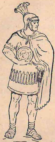
Рис. 68. Одиннадцатая монета.