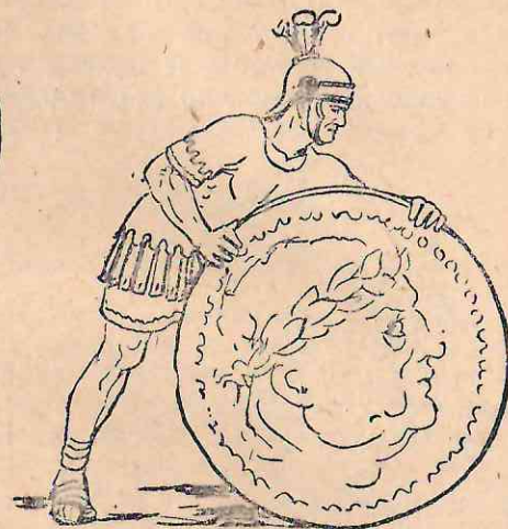
Рис. 72. Семнадцатая монета.