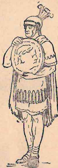
Рис. 69. Тринадцатая монета.