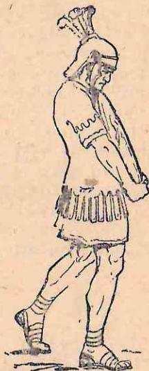
Рис. 70. Пятнадцатая монета.

На четырнадцатый день Теренций вынес из казначейства тяжелую монету в 41 кг весом и около 42 см шириною.