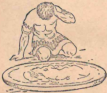
Рис. 73. Восемнадцатая монета.